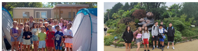
Nettoyons la Nature