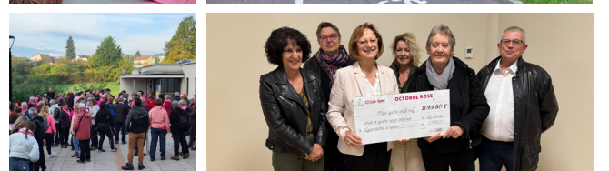
Le Chalet du Breuil - Boutique éphémère