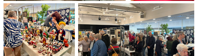
La Brogélienne - Octobre rose